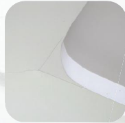
บันทึกรายละเอียดของรูปทรง

เพื่อที่จะตอบสนองการนำไปออกแบบใช้งานที่หลากหลายมากยิ่งขึ้น ฝ้าเส้นระดับสำเร็จรูปสำหรับงานตกแต่ง ชุดเข้ามุม ถูกออกแบบมา เพื่อแก้ปัญหารอยแตกร้าวในบริเวณมุมของฝ้าเส้นระดับ ช่วยลดปัญหา ความเพี้ยนของมุมและส่วนโค้งที่ไม่ได้ มาตรฐาน ใช้ติดตั้งร่วมกับอัลฟาบอร์ด รุ่น L-Box SE100x300TE โดยเฉพาะ ซึ่งเมื่อนำมาประกอบเข้าด้วยกันแล้ว สามารถสร้างสรรคผลงานออกมาได้ ไม่จำกัดรูปแบบ